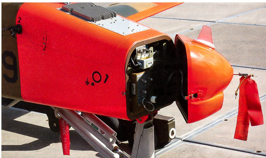
Die geöffnete Drohnenspitze.