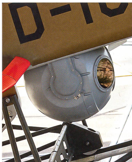
Die leistungsfähige Kamera.