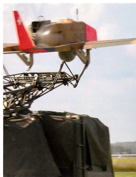
Drohne ab! Vom Katapult gestartet.