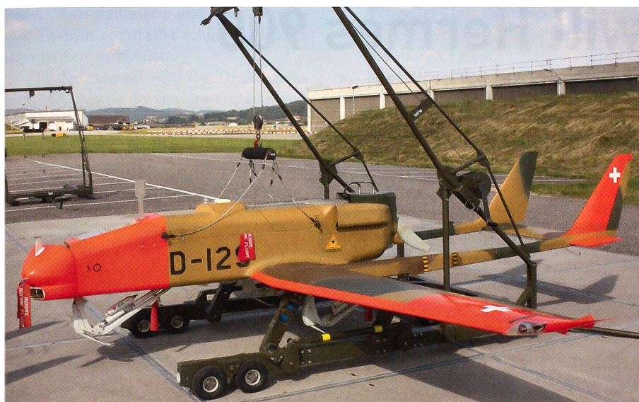
Das israelische Drohnensystem ADS 95 auf dem Flugplatz Payerne.