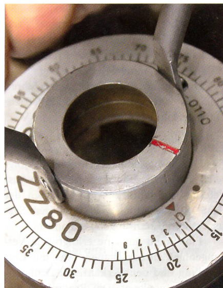
Ganz präzise: Der Zeitzünder.