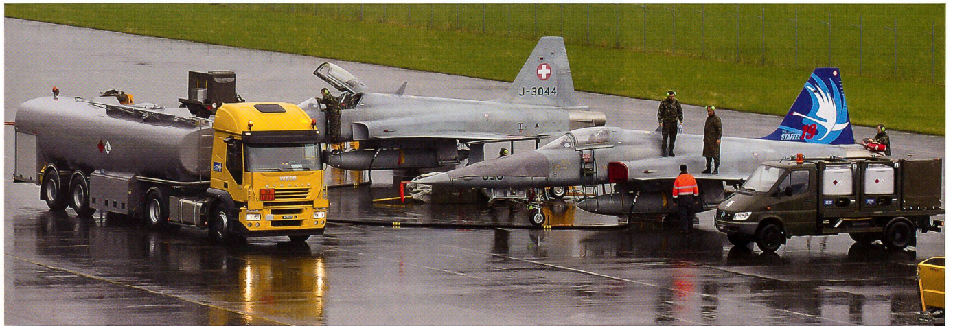
Die Bodencrew des Flpl Kdo 13 aus Meiringen ist bei strömendem Regen in Buochs an der Arbeit.