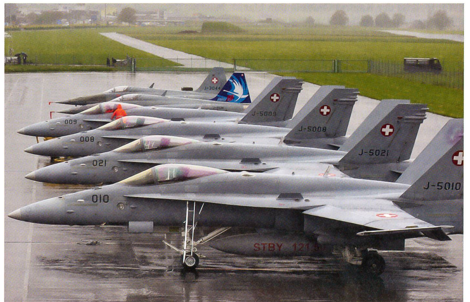
Bereit für den Einsatz ab Buochs, vier F/A-18 Hornet und zwei F-5E Tiger.