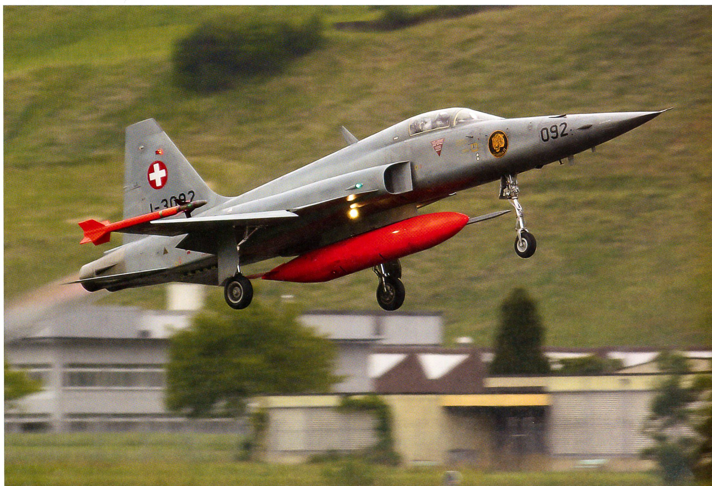
Ein Tiger F-5E startet anlässlich der Übung «REVITA» 2014 auf dem Flugplatz Buochs.