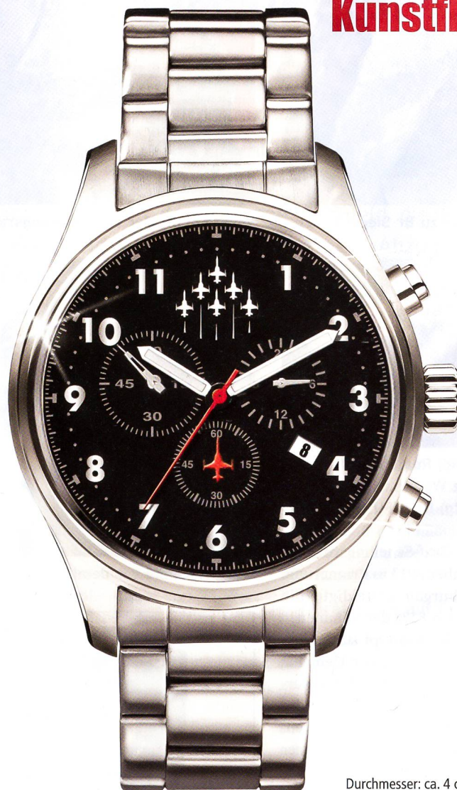
Durchmesser: ca. 4 cm