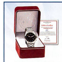
Mit Echtheits-Zertifikat und Präsentations-Box

2014 feiert unsere Jet-Kunstflugstaffel ihr 50-jähriges Bestehen. Heben Sie mit den rot-weissen Jets ab und feiern Sie mit! Die Armbanduhr „Faszination rot-weiss“ zeichnet sich durch einen hohen Anspruch an Design und Verarbeitung aus. Sie ist exklusiv bei Bradford erhältlich und lässt das Herz jedes Aviatik-Fans höher schlagen.