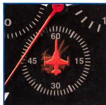
Der Zeiger in der Form einer F-5E Tiger II