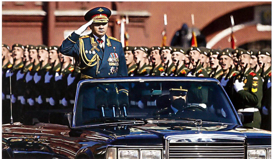
Sergej Schoigu am 9. Mai 2014 an der Siegesparade für 1945 auf dem Roten Platz.

Energiesektors. Gazprom und Rosneft sind beherrschende Konzerne; ohne das Geld aus dem Gas- und dem Öl-Geschäft geht nichts.