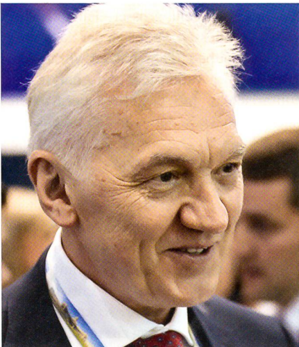
Gennadi Timtschenko, bis vor kurzem Chef des Rohstoffkonzerns Gunvor .

Sein Clan umfasst zwei Wirtschaftsgrossen: Alischer Usmanow, den Direktor der Holding Gasprominvest , und Alexej