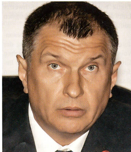
Igor Setschin, CEO Rosneft , den viele für den zweitstärksten Russen halten.