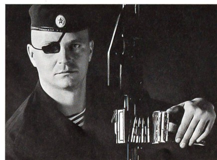
Speznas mit falschem Namen: Wiktor.

Allein die Nennung der Shajetet 13 , der Kampfschwimmertruppe der israelischen Marine, zeigt, wie willkürlich die Rangliste ist. Weshalb fehlt die ebenbürtige Sayeret Matkal , die Speerspitze des Generalstabs?