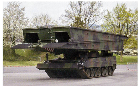
Neuer Brückenpanzer, pardon: Brückenlegesystem.