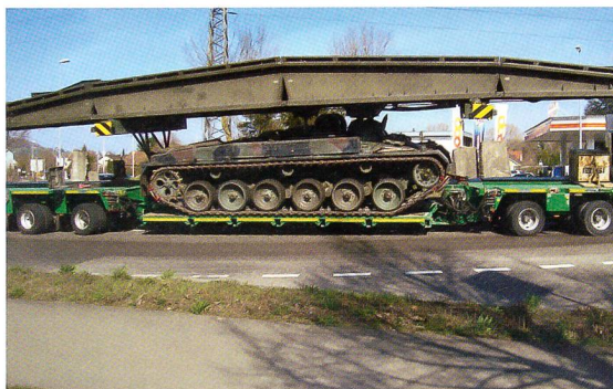
Der Brückenpanzer 68/88, eindeutig ein Panzer.