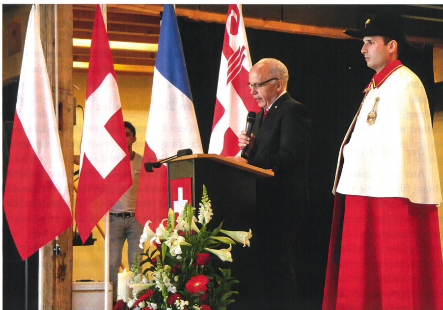
Für Bundesrat Maurer war es ein persönliches Anliegen, an der Feier teilzunehmen. Er würdigte die Ereignisse vom 1940 in bewegenden Worten.

1353 Hektaren Wald wurden gerodet, 1000 Hektaren Brachland urbar gemacht und 7000 Tonnen Steinkohle gefördert. Für die Landesverteidigung wurden 10 000 Arbeitstage, für die Landwirtschaft rund eine Million Arbeitstage geleistet. ✝