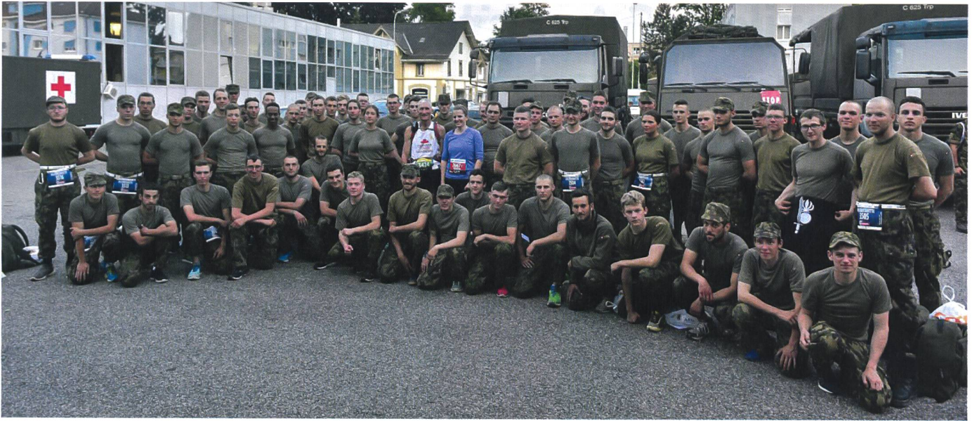
Die Infanterie-Offiziersschule nahm am Stafettenwettkampf des Bieler 100-km-Laufes im Rahmen der Durchhalteübung teil.