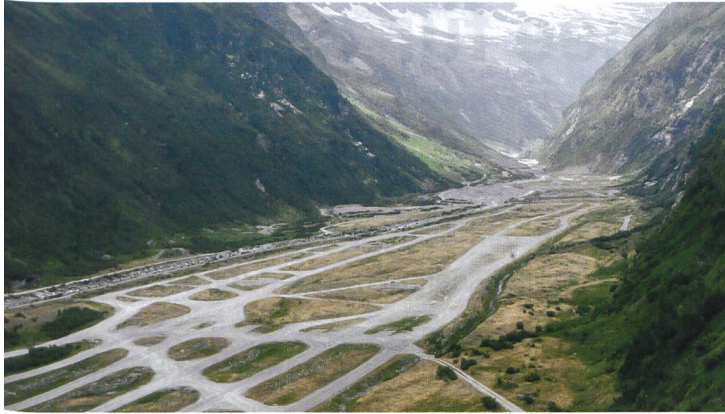
Der Schiessplatz Hinterrhein von oben.