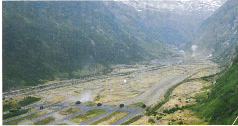
Ein Schützenpanzer und vier Panzer kämpfen sich nach vorn.

satz – auch auf dem Schiessplatz – unumgänglich ist. Somit werden Sie vermutlich in Zukunft vermehrt auch Schützenpanzer 2000 auf diesem Platz sehen.»