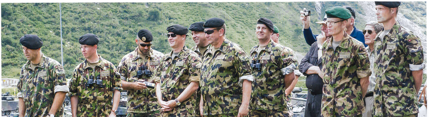
Sachkundige Experten beobachten genau die Vorführung zum Jubiläum.

Wellinger: «Ich persönlich bin dezidiert der Meinung, dass der gemischte Ein-