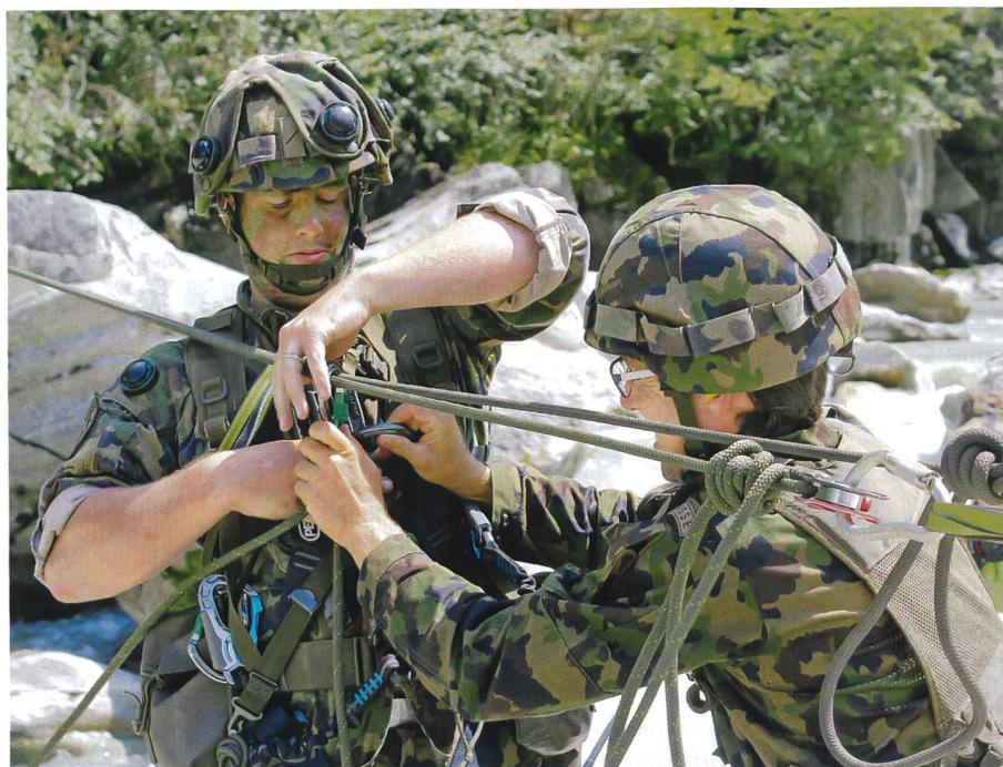
Ein Infanterist (links, erkennbar an der Sim-Ausrüstung auf dem Helm) wird von einem Gebirgsspezialisten an der Übersetzstelle über die Reuss am Seil eingeklinkt.

Die beiden wohnen der Übung als Gäste bei und werfen den Soldaten bei ihrer Arbeit einen Blick über die Schulter. Die Wertschätzung und das Interesse der Verantwortungsträger der hiesigen Exekutive sind von grosser Bedeutung sowohl für die Behörde als auch für die Armee, sind sich