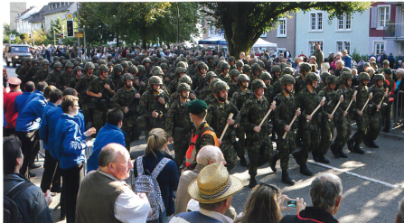
Der Vorbeimarsch des Geniebataillons 6.