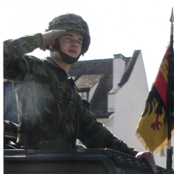
Gruss vom Schützenbataillon 14.