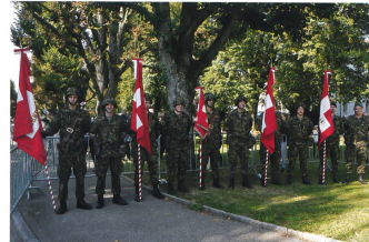
Die Fähnrüche der Territorialregion 2.