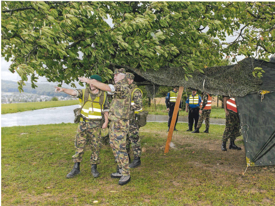
Brigadier Maurizio Dattrino, Kdt Geb Inf Br 9, beim Besuch der Truppen im Einsatz.

kannten Ablauf Einsatz, Reserve und Ruhe entsprach. Eine eigentliche Reserve war durch das GWK nicht gefordert und die langen Verschiebungen in den Einsatzraum erforderten Einsatz-, Einsatzvorbereitungs- und Retablierungselemente.