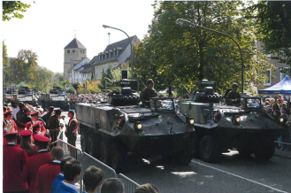
Das Infanteriebataillon 20 bei der Vorbeifahrt.