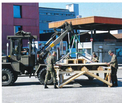
Die Genie zeigt den Brückenbau.

Durchgeführt wurde die grosse Volltruppenübung von der Territorialregion 2 unter der Führung ihres Kommandanten,