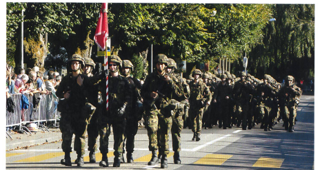
Das Fahndetachement der Territorialregion 2 bildet den Abschluss des Defilees.