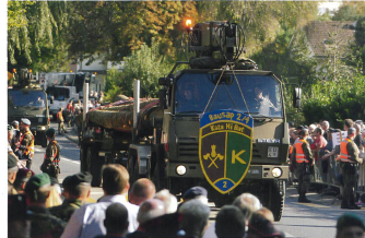
Ein Spezialfahrzeug des Kat Hi Bat 2.