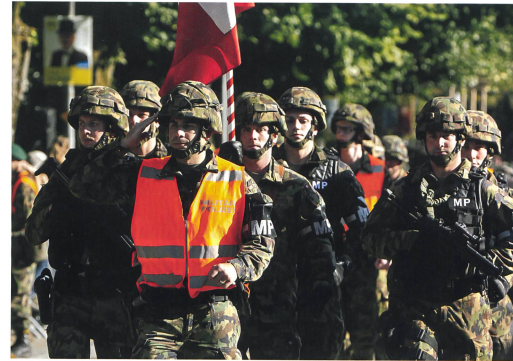
Das Militärpolizeibataillon 2 beim strammen Vorbeimarsch.