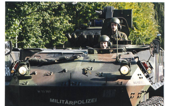
Die Militärpolizei mit gepanzertem Fahrzeug.