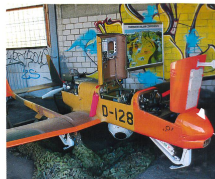
Drohnenkommando präsentiert Mittel.