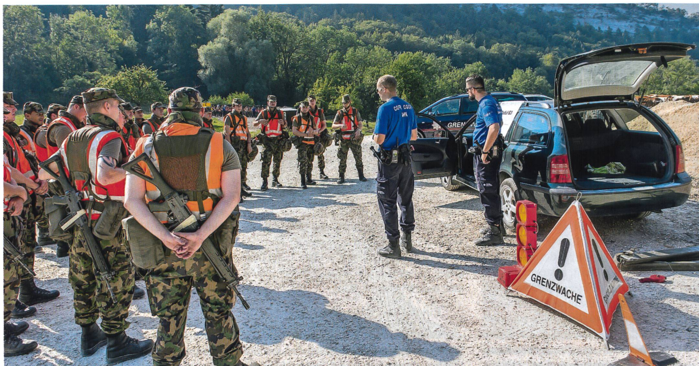
Einsatzbezogene Ausbildung mit den Profis des Grenzwachtkorps.

Die Kompanien arbeiteten mit einem Dreierdienststrad, das aber nicht dem be-