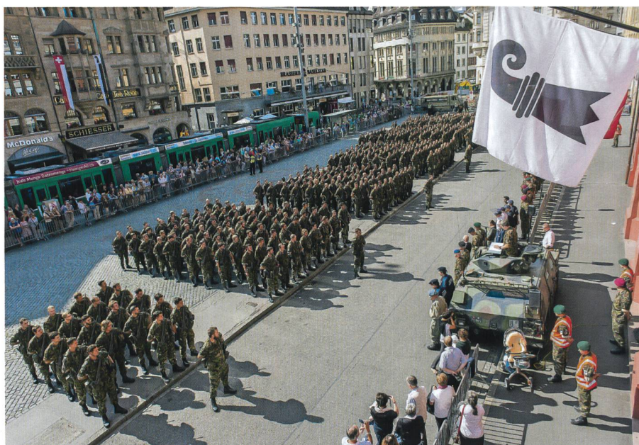
Fahnenabgabe auf dem Marktplatz in Basel – vor zahlreichem Publikum.