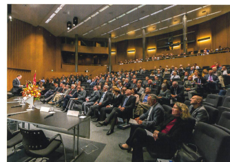
Blick ins gut besetzte Auditorium Maximum der ETH Zürich.

militärischen Führers. Im Rahmen einer OSZE-Beobachtergruppe wurde er als Teamleiter im Frühling 2014, zusammen mit einigen Kameraden, in Slovansk (Ukraine) als Geisel genommen und mehrere Tage gefangen gehalten.