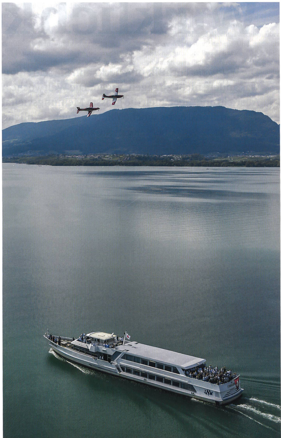
Die Rapportteilnehmer auf dem Neuenburgersee, Überflug von PC-7 und PC-21.