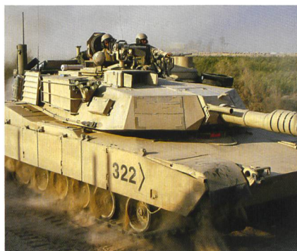
Der amerikanische Panzer Abrams.

Voraussetzung für das Aufeinanderprallen von T-90 und Abrams wäre indessen ein Schulterschluss von Russland und den Vereinigten Staaten im Kampf gegen den ISIS. Erst wenn sich die Präsidenten Obama und Putin auf ein gemeinsames Vorgehen gegen die Jihadisten einigen würden, könnte es zum direkten Duell von russisch und amerikanisch konstruierten