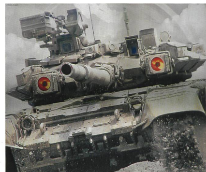
Russischer Kampfpanzer T-90.

Panzern kommen. Was die Führung, die Mannschaften und die Versionen betrifft, wäre es ein ungleiches Kräftemessen: