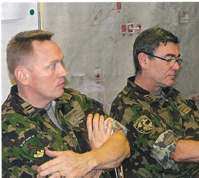
ROT beobachtet, was ZIVIL einwirft und wie BLAU reagiert.