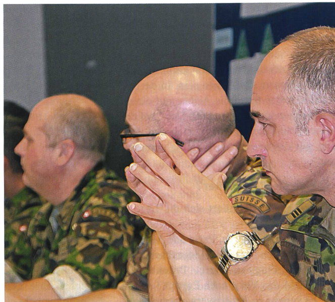
BLAU verteidigt die Schweiz und deren Bevölkerung sehr gut.

die FEV-Fälle häufen, rechnen die Behörden mit einer Flüchtlingswelle.