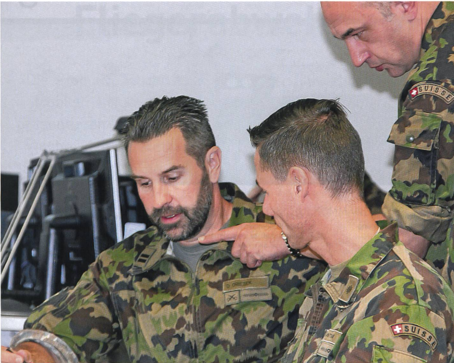
Wieder schlug der Rote Kreis zu. Sofort berät BLAU gründlich.

mit den Schweizer Behörden; aber sie verteidigen ihre Bollwerke. In der Westschweiz trifft MAP eine bedeutende Pharmafabrik hart.