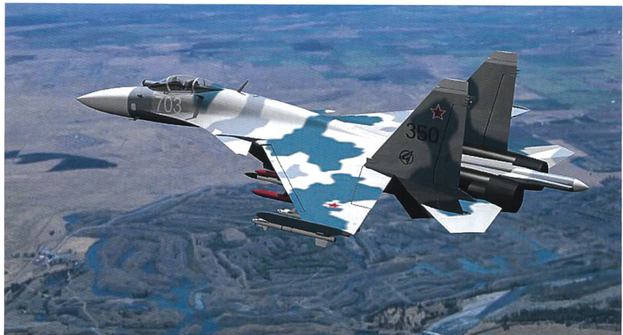
Der russische Generalstab verlegte auch moderne Su-30-Maschinen nach Latakia.

Seit jeher setzten die sowjetischen Streitkräfte auch relativ altes, aber bewährtes und einfach zu handhabendes Material ein; Beispiele aus dem Heer sind die AK-47 Kalaschnikow und die RPG-7-Panzerbüchse. AK-47-Gewehre werden seit 1946 hergestellt, RPG-7-Raketen seit 1961. Wie unser Korrespondent betont, rechnete die russische Führung vor dem ersten Bombenangriff am 30. September 2015 mit wenig nennenswertem Widerstand. So habe sie den Einsatz der alten Flugzeuge verantworten können.