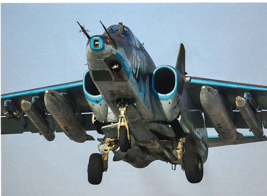
Der Erdkämpfer Su-25 (NATO-Code Frogfoot) ist wie der Su-24 ein älteres Modell.

ist, versteht sich. Würde die gut ausgebaute Strasse in die Hand des ISIS fallen, wäre der Herrschaftsbereich der Regierung an einer zweiten und höchst empfindlichen Stelle durchtrennt: Präsident Asads Restreich würde dann in einen schwachen Nord-, einen ebenso schwachen Mittel- und einen isolierten Südteil um Damaskus zerfallen.