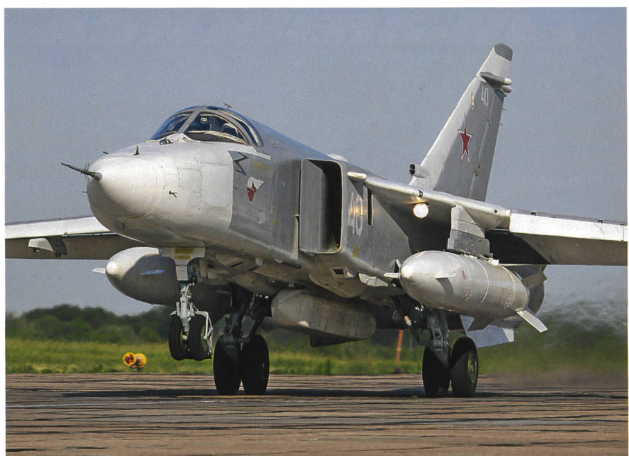
Der Frontbomber Su-24, ein relativ altes Schlachtross der russischen Luftwaffe.

Bei der M5 handelt es sich um die wichtigste Strasse von Syrien: Sie verbindet über Hama und Homs die frühere Handelsmetropole Aleppo im Norden mit der Hauptstadt Damaskus im Süden. Dass die M5 für das Asad-Regime überlebenswichtig