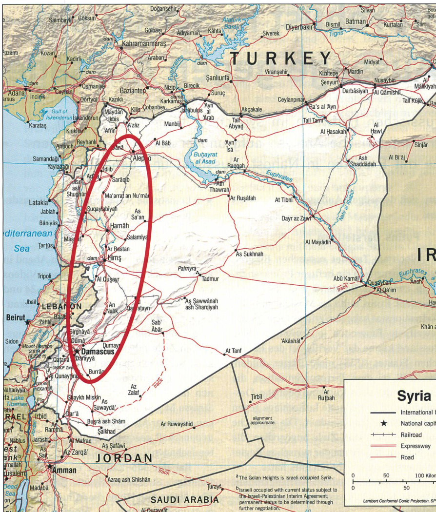
Die neutrale Karte zeigt die überragende Bedeutung der Strasse M5, die Damaskus im Süden über Homs (hier Hims) und Hama (Hamah) mit Aleppo verbindet.