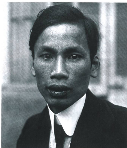
Der junge Ho Chi Minh 1921 in Paris. Bevor er 1941 nach Vietnam zurückkehrte, war er fast 30 Jahre im Ausland.

Während der junge Ho Chi Minh ab 1913 die USA bereiste, dann in London und anschliessend sechs Jahre in Paris arbeitete, wurden im 1. Weltkrieg 100 000 Vietnamesen als Arbeitskräfte und Soldaten nach Frankreich geholt. In Paris machte sich Ho einen Namen als Journalist und Autor, der vor allem gegen den Kolonialismus schrieb,