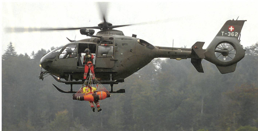
50 Jahre Heli-Basis Alpnach: Lesen Sie den Jubiläumsbericht auf den Seiten 34–35.