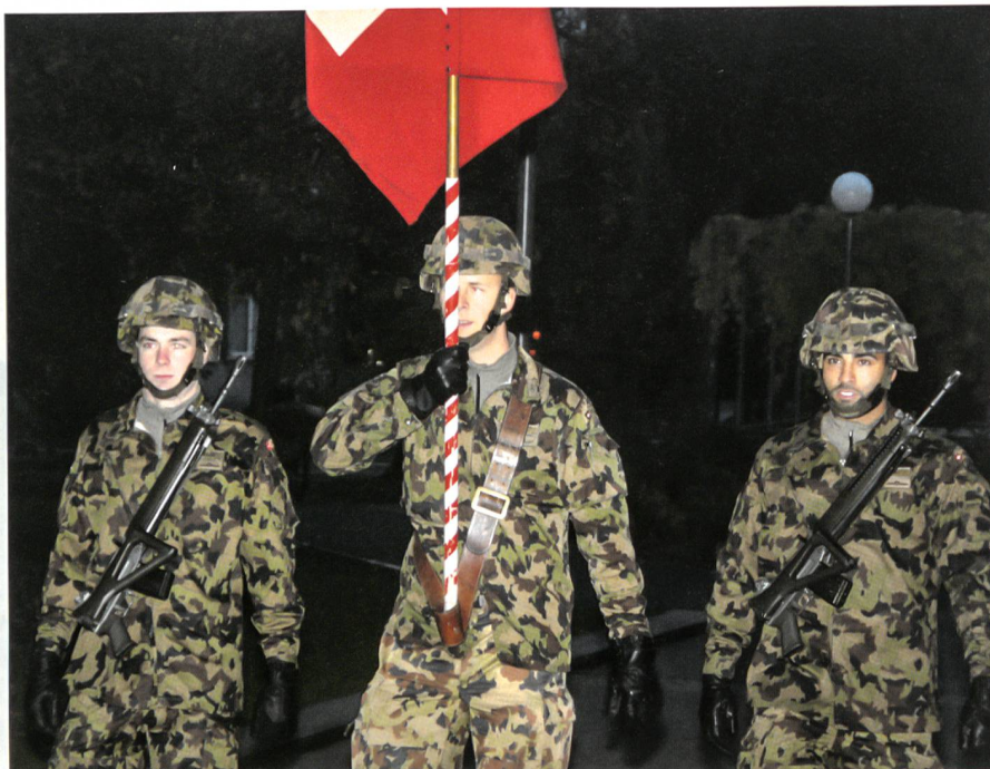
Der Aufmarsch des Feldzeichens vor dem Fahngruss.

Der Entbehrungen waren vielerlei: Unsere Wehrmänner hätten Haus, Hof und