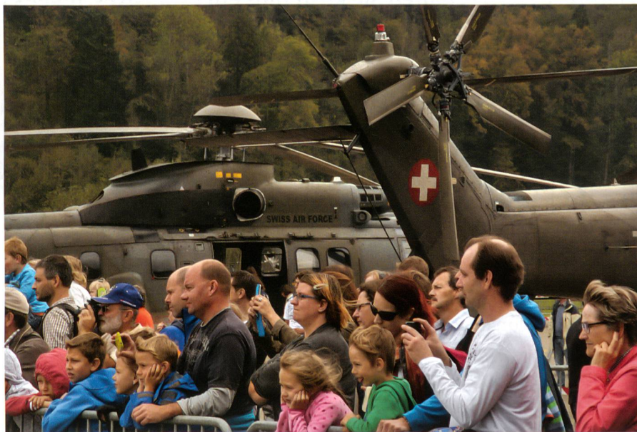
Grosser Publikumsaufmarsch am Tag der Öffentlichkeit in Alpnach.