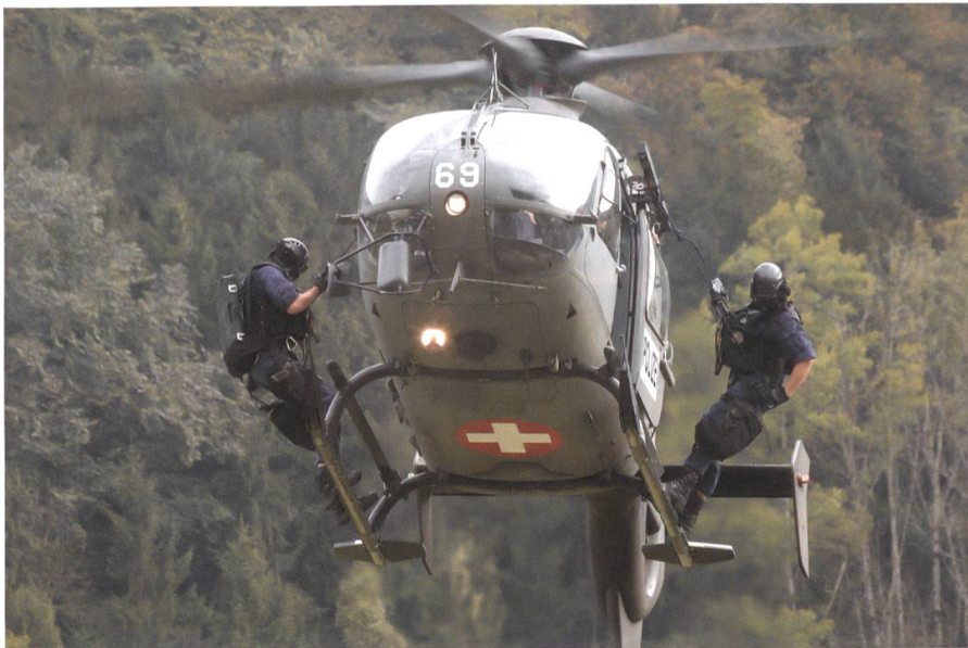
Luftwaffe und Kantonspolizei Obwalden: Zwei Polizeigrenadiere im Einsatz.

Luft- und Bodenorganisation: Ausbildung, Training, Einsatz, Betriebskompetenzstelle, Betrieb und Bereitstellung sowie Instandhaltung/Instandsetzung/Trouble Shooting. Im Wechsel mit zwei Militärflugplätzen finden regelmässig Such- und Rettungsflüge statt.