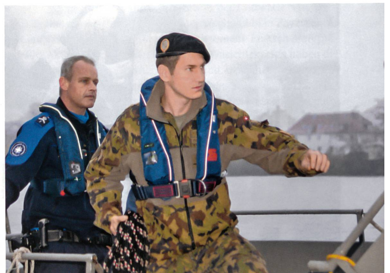
Gleich legt das patrouillierende P80-Boot an.