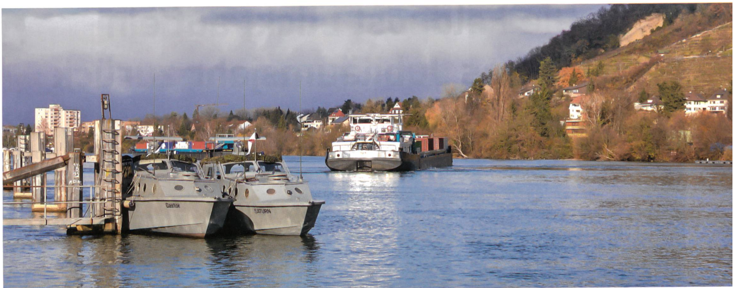
Boote während der Ausbildung.