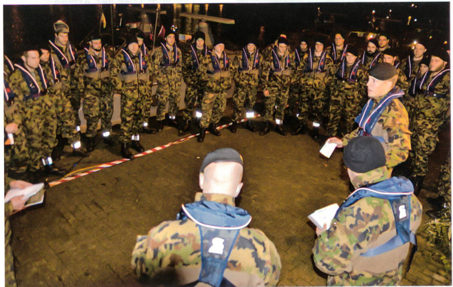
Der Kommandant orientiert die Truppe zum Ernstfalleinsatz.