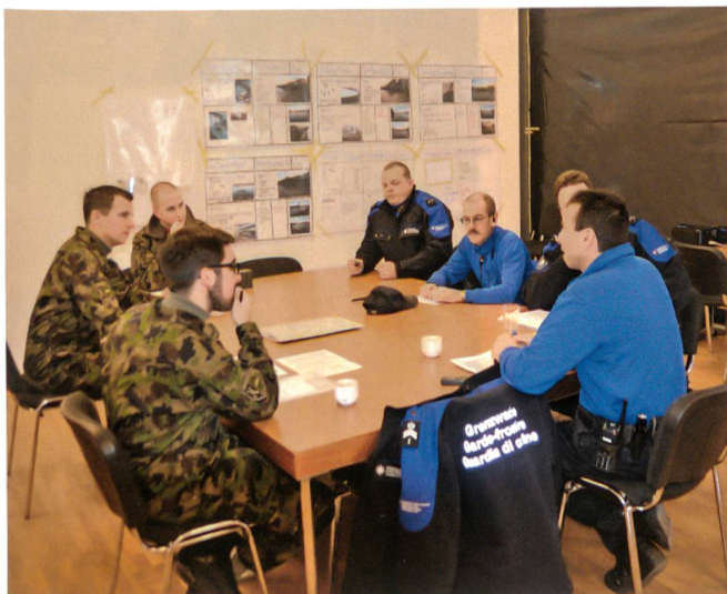
Grenzwehr und Armee: Rapport im Einsatz «ALCEO».