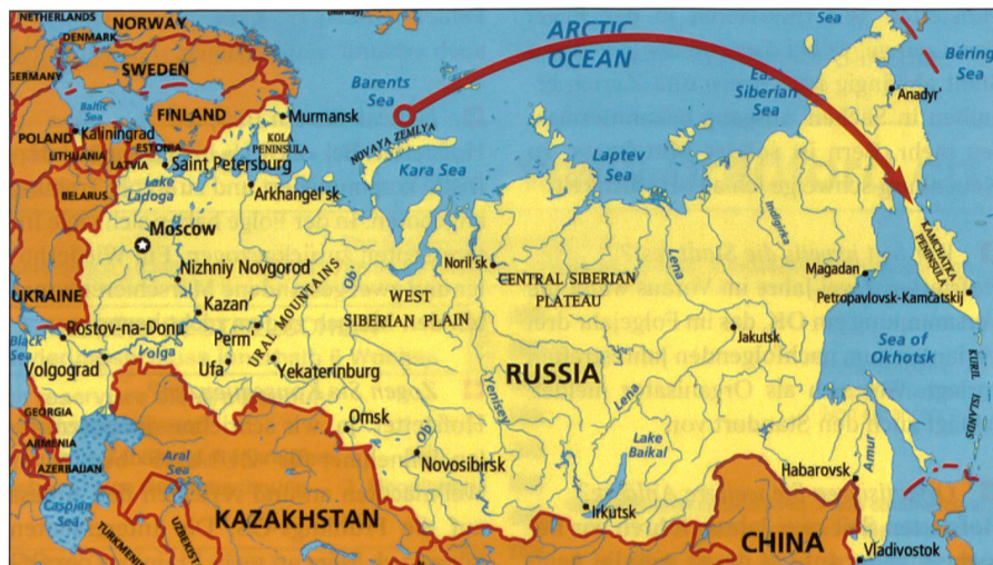
Die Flugbahn führt von der Barentssee zur Halbinsel Kamtschatka im Westpazifik.