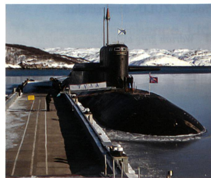
Tula K-114, Delta IV, gehört zur Nordflotte. Hier in Gadzhijevo, Murmansk.

In Kura landen R-29RMU Sinewa, RT-2PM2 Topol-M (NATO-Code: Sickle) und RSM-56 Bulawa (SS-NX-32).