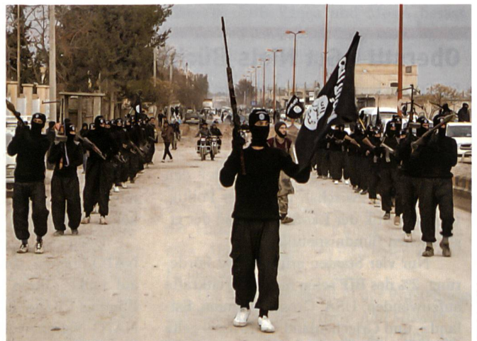
Schwarz gekleidete Krieger. Schwarz ist ihre Kriegsfarbe.