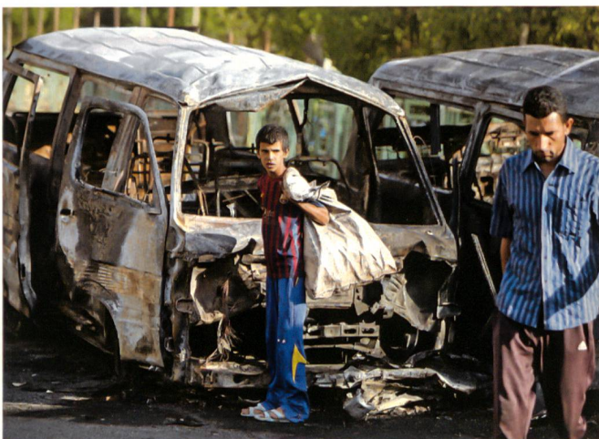
So sieht es nach einem terroristischen Anschlag des ISIS aus.