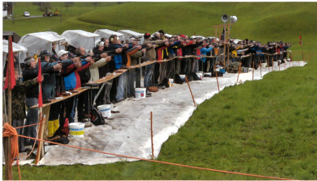
Pistolenschützen an historischer Stätte.

Das nächste Morgartenschiesse steht im Zenit der 700-Jahr-Feier. Die Organisatoren beider Verbände (Morgartenschützenverband und Pistolensektion UOV Schwyz) hoffen auf einen Grossaufmarsch. Seit Jahren sind sie Garant für einen reibungslosen Ablauf der beiden patriotischen Grossveranstaltungen. Morgarten 2015 ruft – wir kommen!