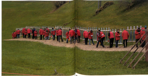
Gut sichtbar und geschützt in roten Jacken: Die Zeigerinnen und Zeiger am Werk.