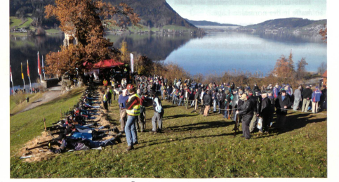
Gewehrscützen hoch über dem Agerisee.