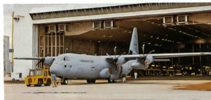
Zweites Transportflugzeug C-130J für die tunesische Luftwaffe.

Lockheed Martin hat Mitte Dezember den letzten von zwei fabrikneuen C-130J-Hercules-Transportern an die tunesische Luftwaffe übergeben. Im Februar 2010 bestellte das nordafrikanische Land bei Lockheed Martin zwei modernste C-130J-Super-Hercules-Transporter, die erste Maschine wurde im April 2013 ausgeliefert und nun konnte die zweite C-130J dieses Auftrages übergeben werden. Die Maschine ist in Tunesien auf TS-MTK immatrikuliert.