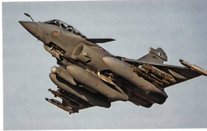
Mehrzweckflugzeug Rafale für die indische Luftwaffe gefährdet?

Der Rafale-Hersteller Dassault wurde im Januar 2012 zum Sieger einer internationalen Ausschreibung für Waffenlieferungen, der grössten in der Geschichte Indiens, erklärt. Ein Kaufvertrag über 126 Mehrzweck-Kampffjets für die indische Luftwaffe wird auf mehr als zehn Milliarden US-Dollar geschätzt. Wie das Online-Magazin «Defense Update» unter Berufung auf den indischen Verteidigungsminister berichtete,