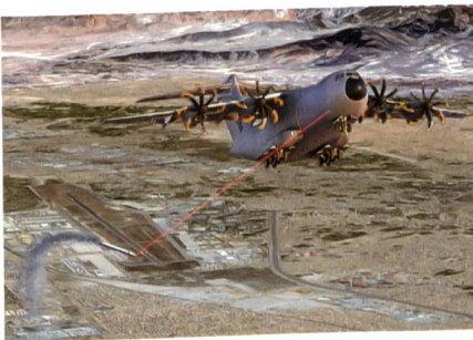
Deutsche A400M werden mit Laserschutzsystem J-MUSIC von Elbit ausgerüstet.

Diehl BGT Defence hat zur Abwehr von Lenkflugkörpern gegen den Transporter A400M den Auftrag zur Projektleitung erhalten, um zunächst drei Systemeinheiten (je 57 kg/1.8 kW) des Laserschutzsystems J-MUSIC (Multi-Spectral Infrared Countermeasure) von Elbit Systems Ltd. in einer A400M zu einem Gesamtsystem unter der Bezeichnung «Flash» zu vernetzen. J-MUSIC setzt sich zusammen aus einer Laser-Generator-Einheit und dem Laserkopf, einer Wärmekamera zur Zielerfassung/-verfolgung, einer drehschnellen Spiegelkanzlei