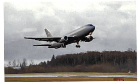
Erfolgreicher Erstflug für die KC-46.

Die Boeing 767-2C startet zu ihrem ersten Testflug, welcher 3 Stunden und 32 Minuten dauerte und problemlos verlief. Boeing baut insgesamt vier Testflugzeuge, zwei 767-2C und zwei KC-46A. Die Boeing 767-2C ist die Frachtervariante und be-