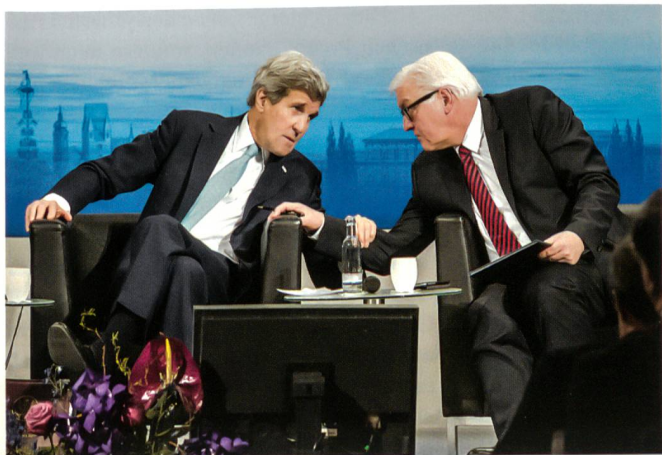
Die Aussenminister Kerry (USA) und Steinmeier (Deutschland).

Allerdings tobten am 15. Februar heftige Kämpfe um den Kessel von Debalzewe. In der Nacht zum 12. Februar hatte Russland 50 T-80-Kampfpanzer, 50 Schützenpanzer und 50 Raketenwerfer über die Grenze geführt (drei Bataillone).