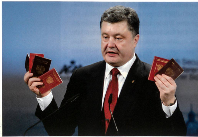
Präsident Poroschenko zeigt russische Pässe «von der Front».