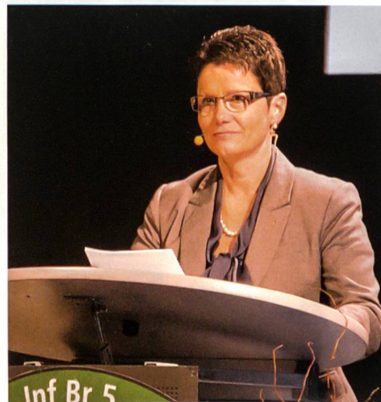
Die Obwaldner Regierungsrätin Maya Büchi bekennt sich zu Sicherheit und Stabilität der Schweiz.