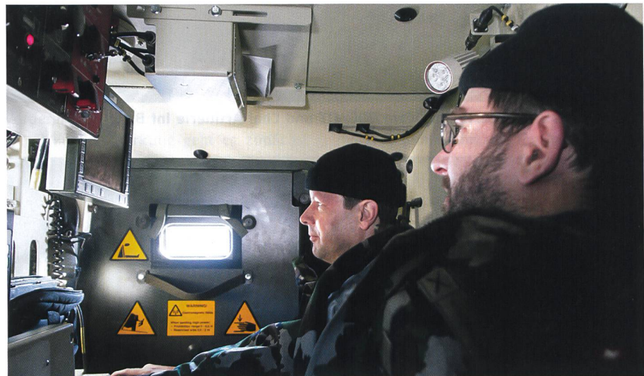
Die Feuerleitstelle befindet sich direkt auf jedem Geschütz hinter der Fahrerkabine.