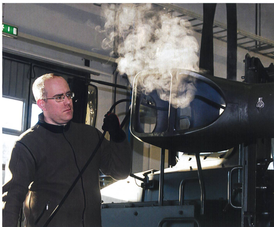
Beim Parkdienst nach dem Schiessen.

Das A9 kann auf eine langjährige Tradition zurückblicken und hat wie die Schweizer Artillerie verschiedene Transformationsphasen mit Reduktionen in personeller und materieller Hinsicht erlebt.