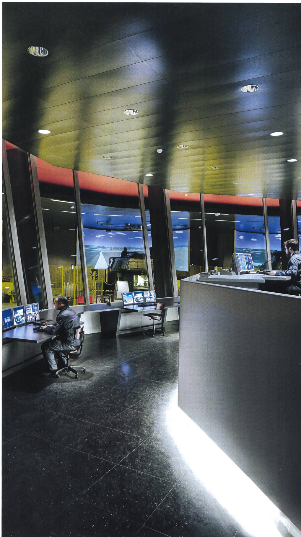
Ruag ist weltweit führend auf dem Gebiet der Artilleriesimulatoren. Hier die Anlage in Bière.