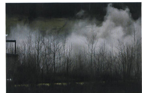
Und das ist es, was übrig bleibt.