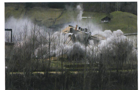
Mit je 30 Millisekunden Zeitverzögerung fallen die vier Hausseiten exakt nacheinander zusammen – exakt wie berechnet.