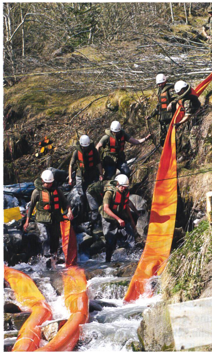
Lenzeinsatz im Bischofbach. Es gelingt, den Bach fast zu 100% trocken zu legen.

Ebenso danken wir dem ganzen Presseteam der Region für die vorbildliche Kooperation.