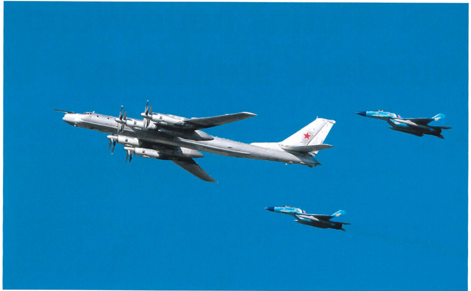
Ein Tupolew-95-Bomber, eskortiert von zwei Begleitjägern mit NATO-Code FLANKER.