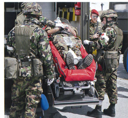
Die Sanität zeigt ihr Wissen und Können.