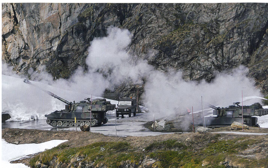
Die traditionsreiche Berner Artillerieabteilung 54 auf dem Simplon: «Schuss ab!»

Ausstellung der vorhandenen weiteren Mittel wie Aufklärungsfahrzeug Eagle, Schützenpanzer 2000, Entspannungspanzer, Funkstationen, Feuerleitstelle und Sanfahrzeuge neuester Generation. Die Logistikfahrzeuge waren dauernd unterwegs. Das Ganze musste dann auch wieder abge-