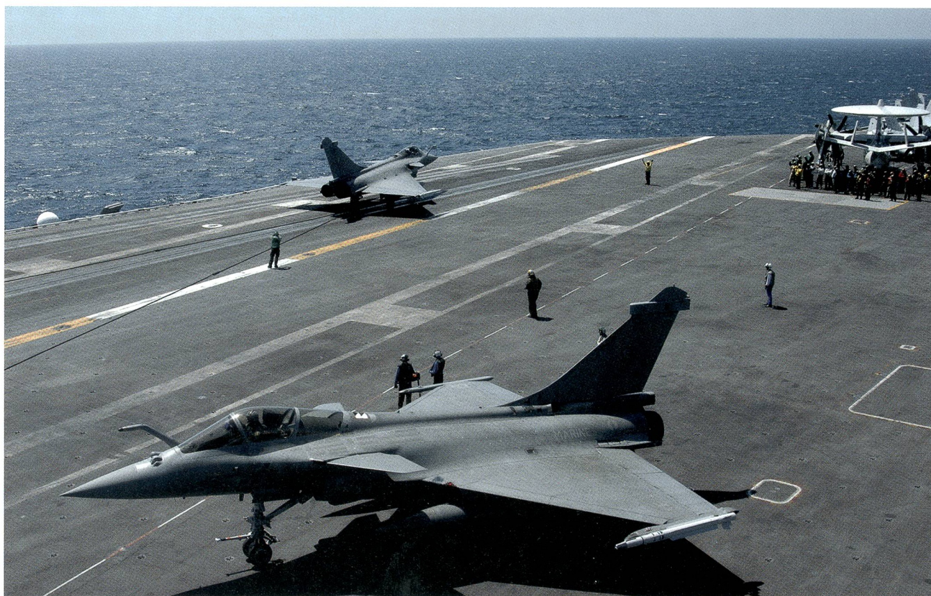
Amerikanisch-französische Kooperation: Zwei Kampfmaschinen des Typs Rafale der Armée de l'air auf einem US-Flugzeugträger.

unter uns Verbündeten ist entscheidend. In der Übung wenden wir genau die gemeinsamen Verfahren an, die im Irak- und Syrien-Einsatz für die Interoperabilität sorgen.»