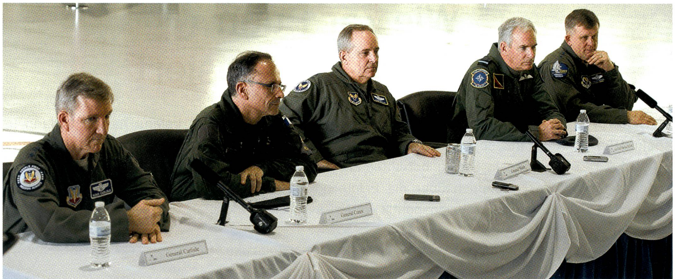
Gen. Carlisle (USAF), General Creux (Armée de l'air), Gen. Welsh (USAF), Air Chief Marshall Pulford (RAF), Gen. Gorenc (USAF).

Die Royal Air Force habe das Cockpit auf den neuesten Stand gebracht, damit es der Typhoon mit Gegnern der fünften Generation aufnehmen könne. Godfrey nannte die russische Allzweckwaffe der Zukunft nicht ausdrücklich; doch muss er an den Suchoi T-50 PAK FA gedacht haben, als er die fünfte Generation nannte.