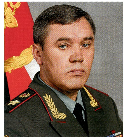
Armeegeneral Waleri Gerassimow.

Im Januar 2013 kündigte Gerassimow eine neue Kriegsführung an. Politische Ziele seien nicht mehr allein mit konventioneller Feuerkraft zu erreichen, sondern durch den «breit gestreuten Einsatz von Desinformationen, von politischen, ökonomischen, humanitären und anderen nichtmilitärischen Massnahmen». Dies alles setzte er 2014 auf der Krim perfekt um.