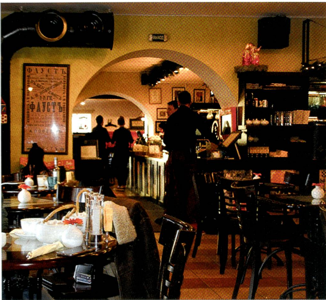
Trotz Sanktionen: Schmuckes Restaurant in der Innenstadt.