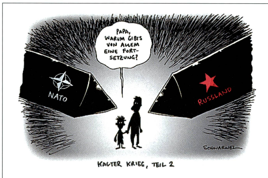
Eine Karikatur, die in Russland Beachtung findet: Kalter Krieg, Teil 2.

gierung bekannt, dies sei dann Unsinn: Man habe keinerlei Trümmer gefunden.