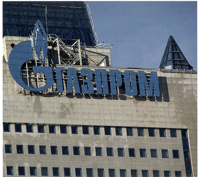
Leidet unter Sanktionen: Das Hauptquartier von Gazprom.