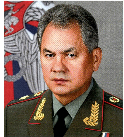
Armeegeneral Sergej Shoigu.

Shoigu tritt leise auf; aber er führt die Streitkräfte am engen Zügel. Öffentlich tritt er jeweils am 9. Mai auf, wenn er auf dem Roten Platz der Paradedruppe entlangfährt. Pressekontakte überlässt er seinem Sprecher Igor Konaschenkow.