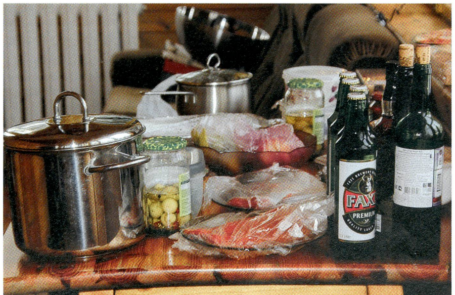
Den kalten Winter nutzen: Die ungeheizte Veranda der Datscha dient als Kühlschrank.

Real jedoch nimmt sich das Szenarium aus, wonach sich Russland an seiner Militarisierung und Hochrüstung überhebt. Gelingt es Putin nicht, die Sanktionen zu lo-