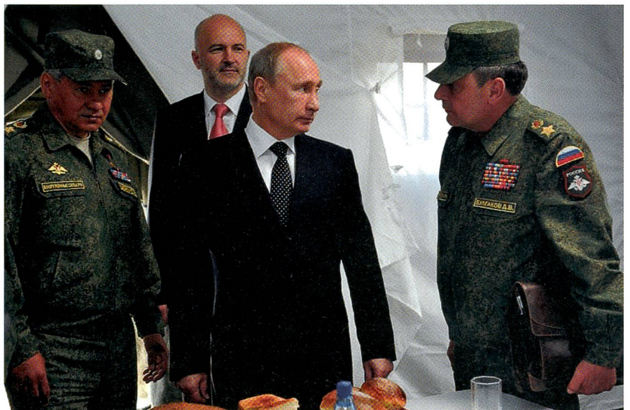
Verteidigungsminister Shoigu, Präsident Putin, stv. Verteidigungsminister Bulgakow.

Noch einmal schaltet der Sender direkt nach Syrien: Su-24, Su-25 und Su-34 schrauben sich schwer bewaffnet in den Himmel. Jetzt kommen die obligaten Trefferbilder, natürlich akkurat, ohne Kollateralschaden. Und dann landen die Helden –