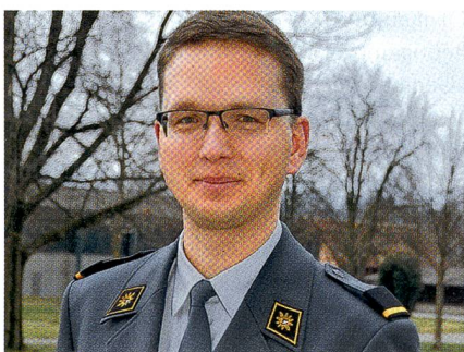
Am Ziel nach langer, harter Arbeit.

der Ristl Kp 17/2 . Nichts entging dem erfahrenen Brigadechef, nicht die kleinste Schwäche. Aber der souveräne Hptm Schönbächler bewahrte stets Ruhe und Übersicht – und bestand auch diese Prüfung.