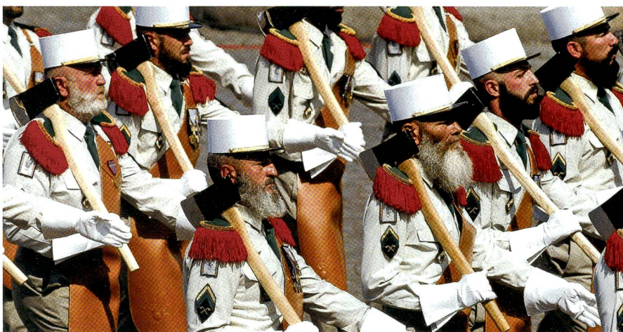
Die französische Fremdenlegion umfasst Soldaten aus 130 Nationen, auch Schweizer.