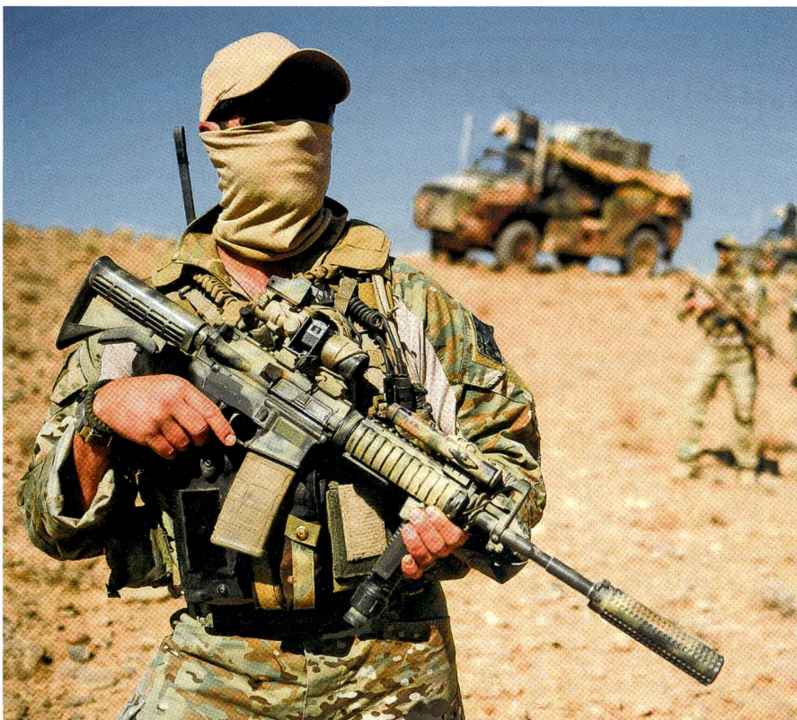
Die britische SAS-Truppe gehört zu den besten Sonderstreitkräften der Welt.

Seit Menschengedenken erzielt der SAS auf der ganzen Welt Erfolge. Die britische Regierung hält The Regiment und dessen Einsätze in der Regel geheim. Aus dem Irak ist bekannt, dass zwischen 50 und 60 Mann die Royal Air Force unterstützen. Mit der Ausdehnung der britischen Luftlein-