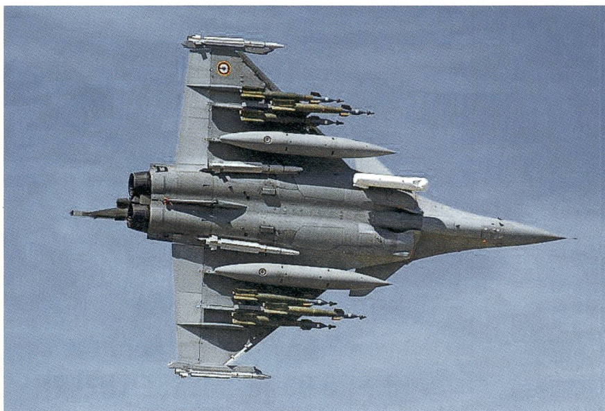
Die französische Luftwaffe operiert auch mit Rafale-Flugzeugen gegen den ISIS.

Vier von fünf Luftschlägen der Koalition der Freiwilligen gegen den ISIS werden von der US Air Force durchgeführt. Von der arabischen Halbinsel und von Flugzeugträgern aus tragen die Amerikaner die Hauptlast des Bombenkrieges – weitgehend mit teurer, intelligenter Munition.