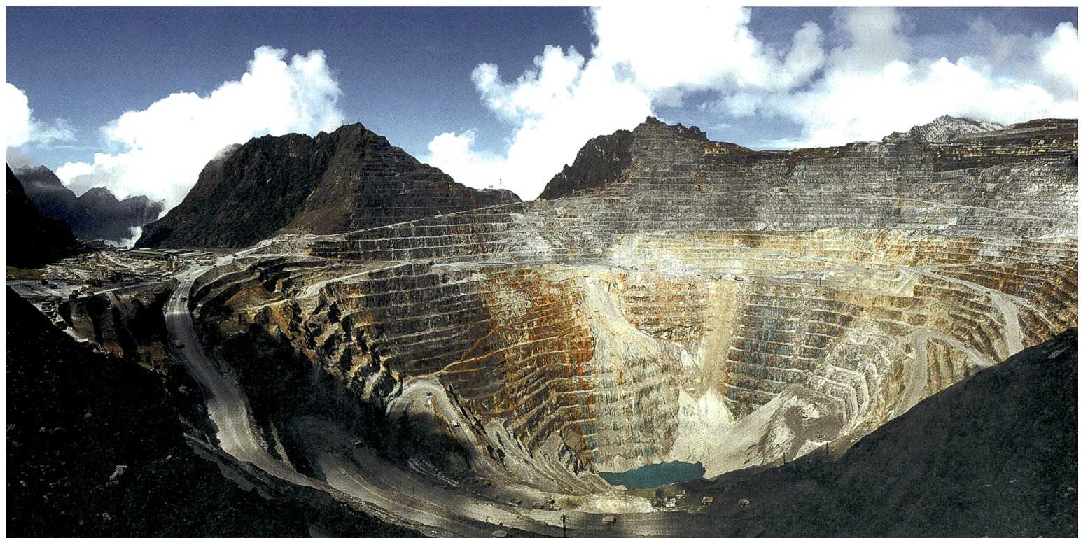
Blick in eine Kupfermine. Jetzt schon ist ein deutlicher Rückgang der Investitionen in die Kupferförderung abzusehen.

So wird allein der Bergbaukonzern Freeport McMoran seine Molybdänförderung um zwei Prozent des weltweiten Angebots kürzen. Zudem ist jetzt schon ein deutlicher Rückgang der Investitionen in die Kupferförderung abzusehen, was aus Sicht der nächsten zehn bis fünfzehn Jahre auch das Molybdänangebot deutlich unter