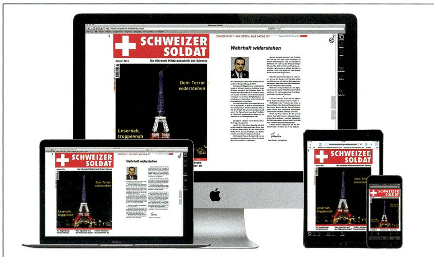
Exakt zusammen mit der Jubiläumsnummer wird das E-Paper aufgeschaltet.

gen Arbeitsgebers war Zentralkassier der SOG und hat deshalb der Übernahme dieses Mandates erfreut zugestimmt.