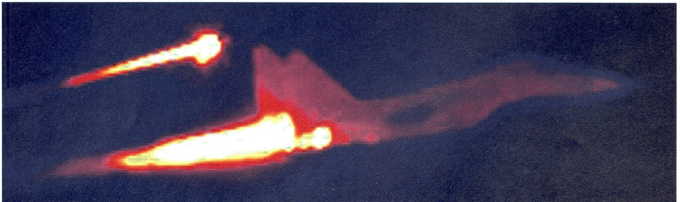
Exklusives Radarbild: Hell tritt der heisse Strahl von zwei Triebwerken hervor. Bei der Maschine handelt es sich um eine MiG-29.