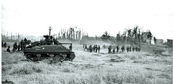
Panzer M4 «Sherman» und Infanterie auf dem Vormarsch Richtung Caen, Normandie Juli 1944.

So aber trafen Montgomery und Model zu einer weiteren Panzerschlacht aufeinander: Ende 1944 in den Ardennen! ❏