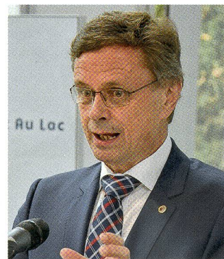
Der Berner Regierungsrat und Oberst Hans-Jürg Käser.