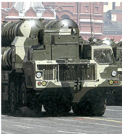
Die S-300 ist ein leistungsfähiges russisches Boden-Luft-Fliegerabwehrsystem.

So schlecht getarnt rollte der S-300-Raketen-Transport auf Tiefladern dem Kaspischen Meer entlang. Nachdem das Raketen-Video aufgeschaltet worden war, bestätigten Moskau und Teheran die Lieferung der Raketen an Iran (unscharfes Videobild).