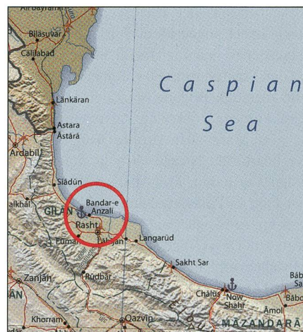
Rot bezeichnet die Hafenstadt Bandar-Anzali, wo die Raketen entdeckt wurden.