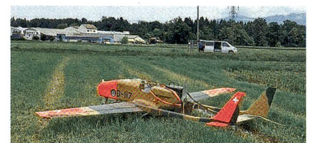
Schweizer Drohne vom Typ ADS-95.