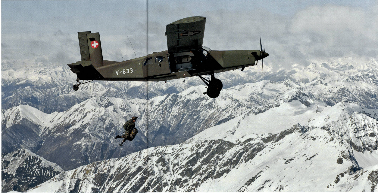
Die Leichtfliegerstaffel (LT St 7) transportiert mit ihren Pilatus Porter PC-6 Fallschirmaufklärer und setzt sie in bis zu 8000 m Höhe ab – im Bild ein Absprung eines «17ers» mit modernster Ausrüstung über den Alpen.

Einsätze bei den amerikanischen «Green Berets» und beim legendären engli-