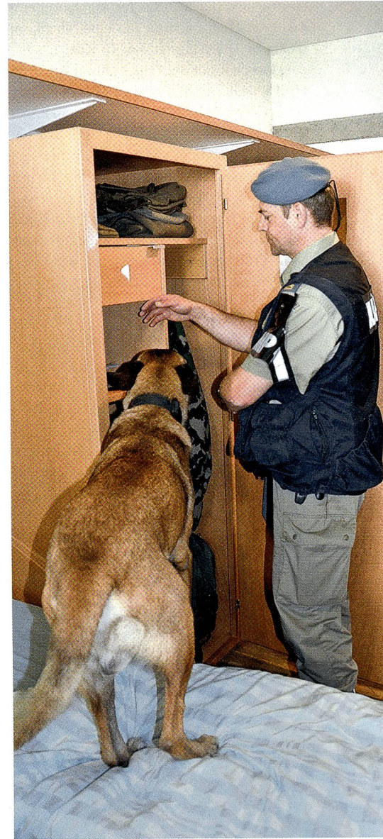
Drogenhund Ares durchsucht einen Schrank.