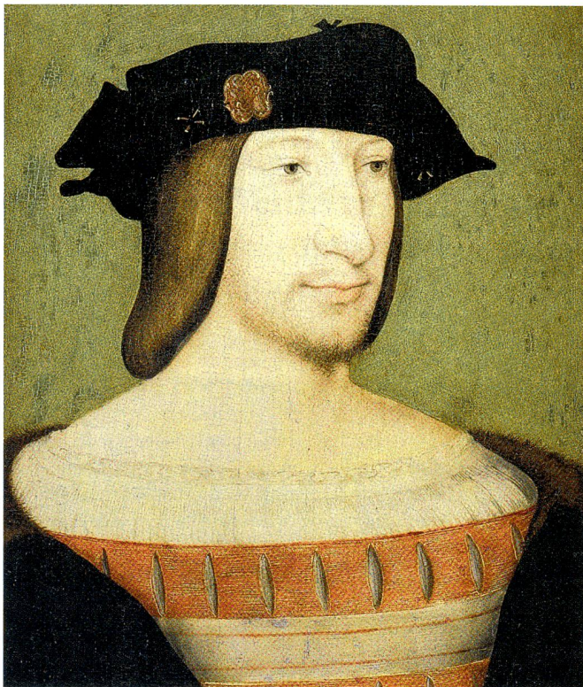
Jean Clouet: Porträt von Franz I. um 1515. König Franz I. erzwang den Durchbruch nach Oberitalien und Mailand.