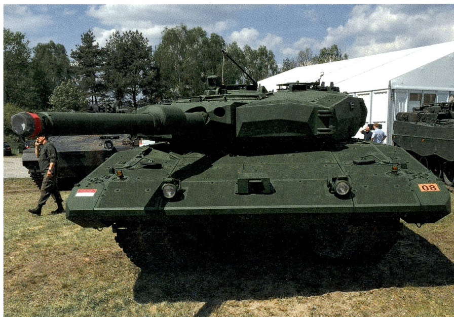
Dieser Leopard 2 wird an Indonesien in einer grösseren Stückzahl ausgeliefert. Bemerkenswert sind die intensive Farbe des Panzers und die rechts und links angebrachten Schürzen. Das Fahrzeug ist einiges breiter als die normale Ausführung.