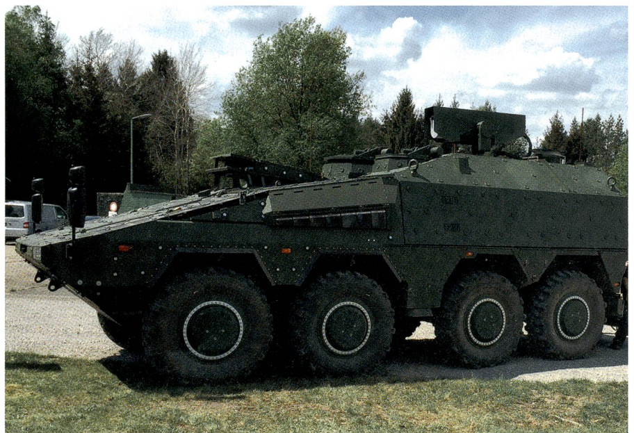
Das gepanzerte Transport-Kraftfahrzeug Boxer dient als Testplattform für die Laserkanone (HEL: High Energy Laser). Die Laserkanone ist gut sichtbar oben angebracht. Die notwendige Energieherstellung findet im Innenraum des Boxers statt.

Zur Zeit fehlten in Europa Transportkapazitäten in ausreichender Zahl wie Flächenflugzeuge und Helikopter, mit denen 5000 Mann in wenigen Tagen verlegt werden könnten. Vor Ort im Baltikum sollten zwei Bataillone der NATO mit schwerem Gerät stationiert sein. Die Angehörigen dieser Verbände müssten zu den Besten gehören, mit modernstem Material ausgerüstet, top trainiert und taktisch sehr gut ausgebildet sein.