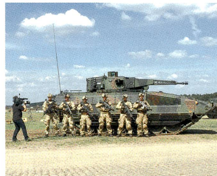
Im Anschluss an die Vorführung präsentierte sich die Infanteriegruppe von sechs Mann den Zuschauern.