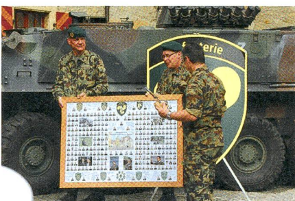
Das Geschenk vom Lehrverband...