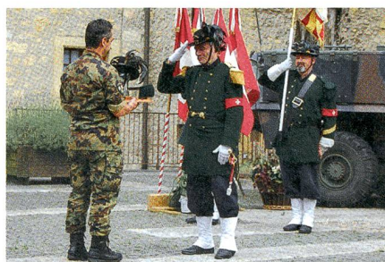
...und von den Carabiniers Genevois.