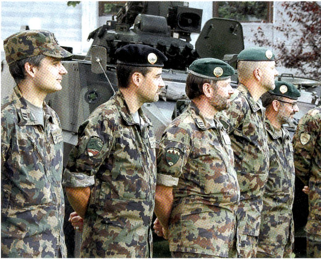
In Reih und Glied: Bataillonskommandanten der Geb Inf Br 12.