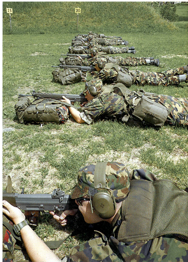
...wie die Gefechtsschiessausbildung für die Log UOS 42.

Anwendung können das Durchsetzungsvermögen und Verantwortungsbewusstsein trainiert werden.