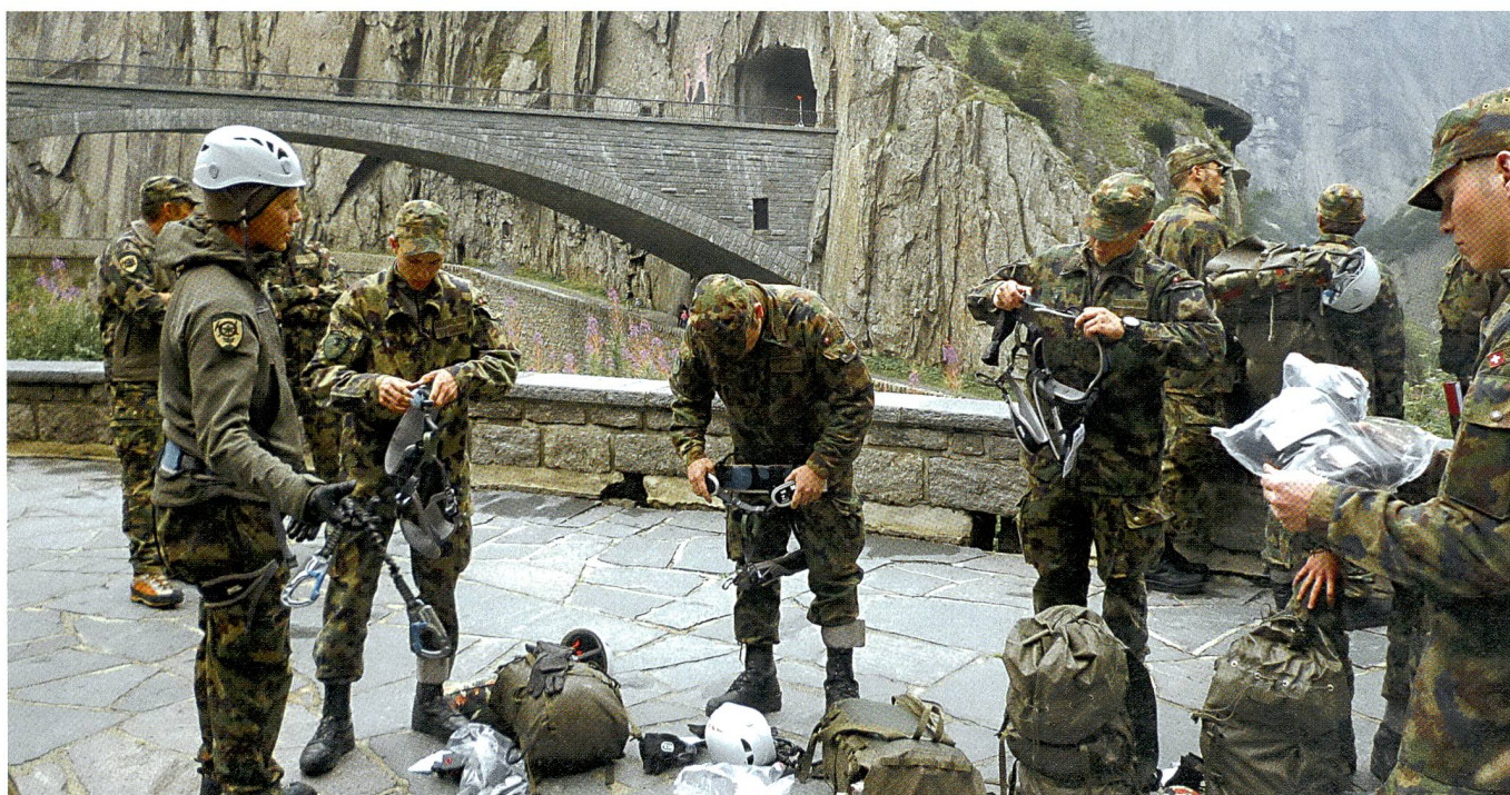
Übungen führen immer wieder zu Orten der Schweizer Geschichte: Hier die Teufelsbrücke am Russendenkmal.

Jede Woche findet eine mehrtägige Führungsübung im Gelände statt, in der militärische Führungsprozesse und -tätigkeiten praktisch trainiert werden. Jede Füh-