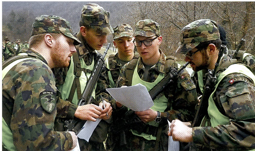
Zwölf Augen sind auf das neue Dokument gerichtet. Jeder bildet sich seine Meinung.