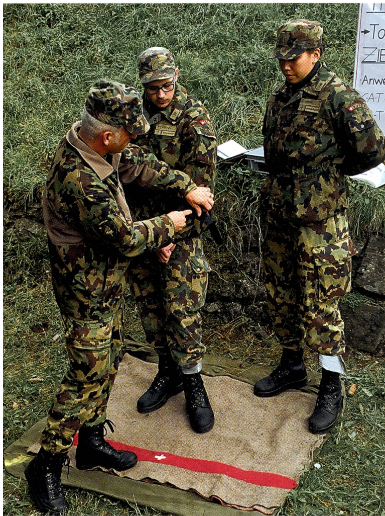
Die Sanitätsausbildung will in den Schulen von Airolo gelernt sein...