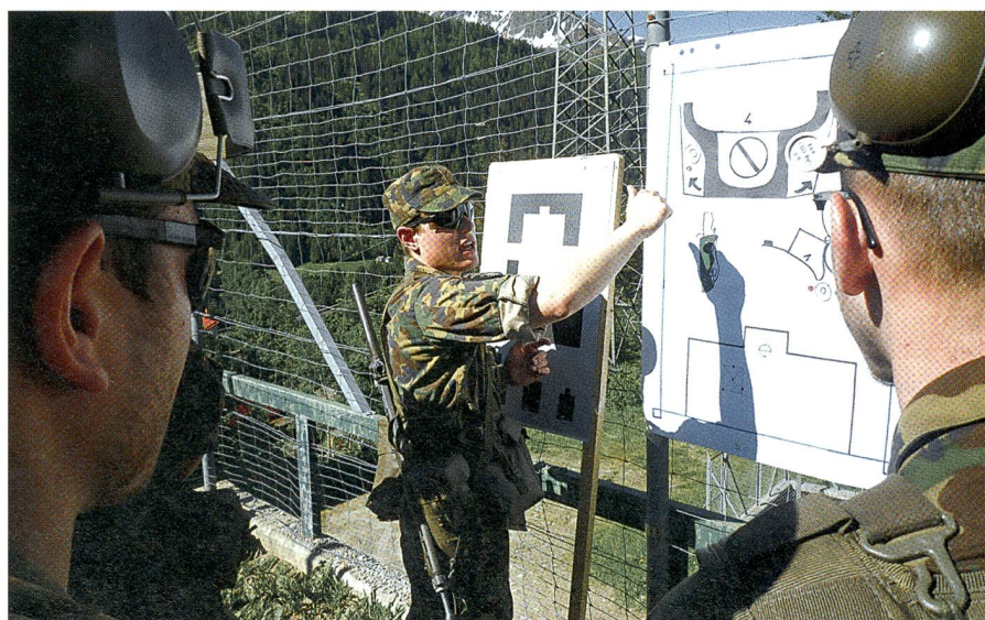
Gute Visualisierung gehört in den anspruchsvollen Schulen von Airolo zum Handwerk.

rungssequenz wird von den Klassenlehrern besprochen und bewertet. Dann erfolgt ein Chefwechsel, um möglichst vielen Anwärtern die Gelegenheit zu geben, das Erlernte im Massstab 1:1 umzusetzen. Zugleich vermitteln die Führungssituationen wertvolle praktische Erfahrungen, die auf der vorgängig vermittelten Theorie aufbauen.