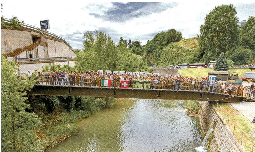
In freundschaftlicher, guter Harmonie: Der italienisch-deutsche Brückenschlag.

Im FU Bat 23 hat die HQ Kompanie 23/1 das HQ in der Zivilschutzausbildungsanlage Rivera bezogen. Die Kompanie stellt mit ihrer Arbeit den Stabsoffizieren der Ter Reg 3 die notwendigen Führungsmittel zur Verfügung, damit die Aufträge termingerecht wahrgenommen werden können.