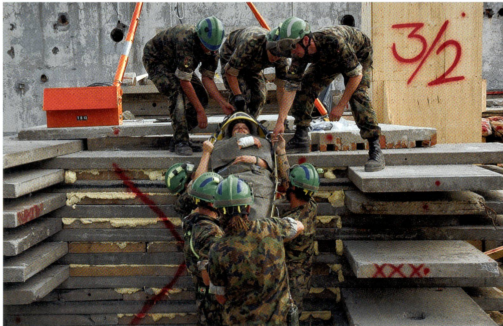
Rettungstruppen im grünen Helm bergen einen Schwerverletzten in grosser Not.

Die Infrastruktur rund um das Zugunglück ist stark getroffen, und die zivilen Behörden stossen an ihre Kapazitätsgrenzen. Viele Wohnungen und Häuser sind völlig zerstört. Die Armee und der Zivilschutz unterstützen bei der Bergung weiterer Personen, welche sich noch unter den eingestürzten Trümmern befinden.