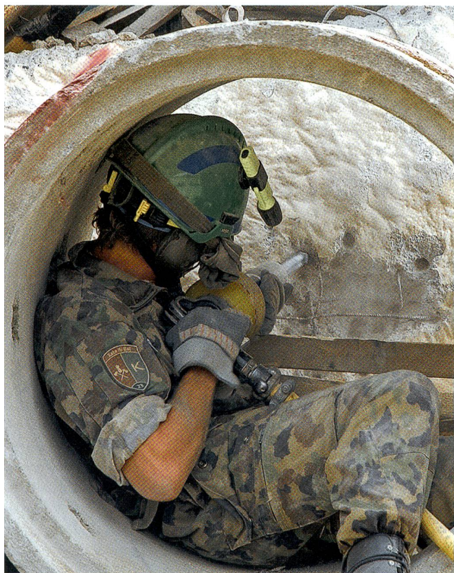
Da sind Spitzenhandwerker und Spitzentruppen gefragt!