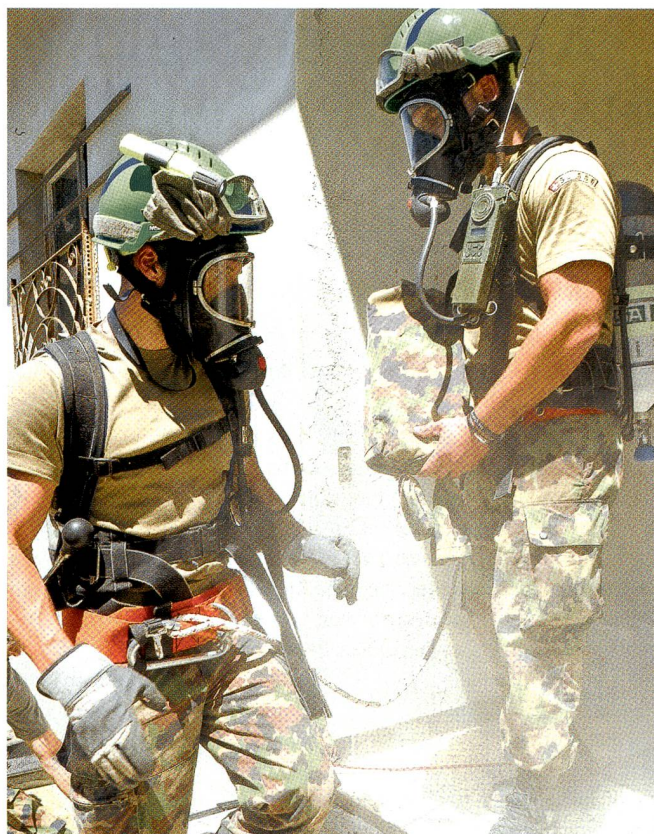
Harte Arbeit bei grosser Hitze. Man beachte den Helmaufsatz!